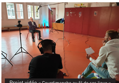
Projet vidéo « Courdimanche au fil de ses lieux »