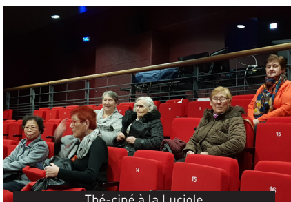
Thé-ciné à la Luciole