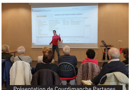
Présentation de Courdimanche Partages