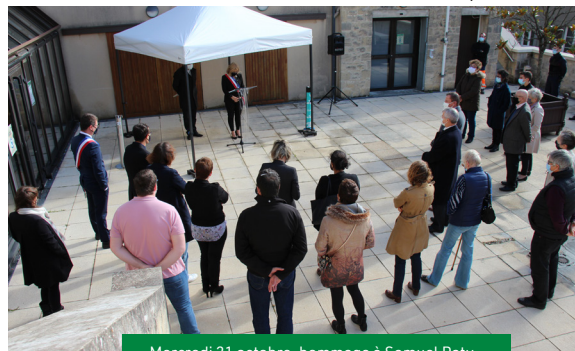
Mercredi 21 octobre, hommage à Samuel Paty

L'espoir et la confiance résonnait dans le message de notre équipe municipale car c'est en effet une situation meilleure qui nous attend.