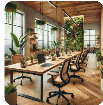
Coworking Tiers-Lieu Ferme Cavan