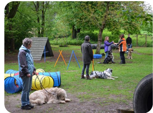
Parcours d'Agilité Canin

Création d'un espace sécurisé de socialisation et de parcours d'agilité pour les compagnons canins.