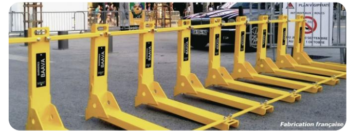
Systemes anti-intrusion lourds

Contrôle d'accès sécurisé centralisé et caméras.